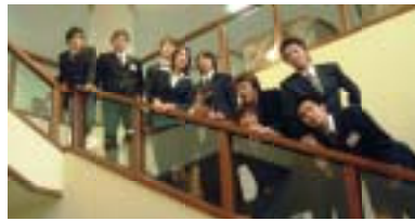
来年はもらってね06会のみなさん

みなさん嬉しそうに笑ってました。誰でも、表彰されるチャンスがあるので、まだ表彰されていない人も次は表彰してもらえようようにがんばりましょう。