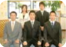
大曲店のみなさん