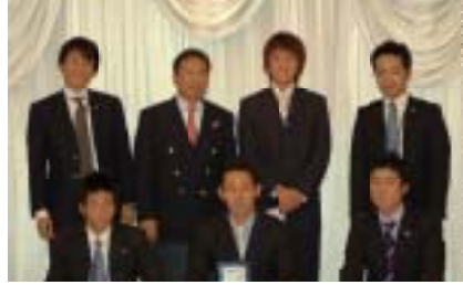
得意車種コンテスト入賞のメンバー