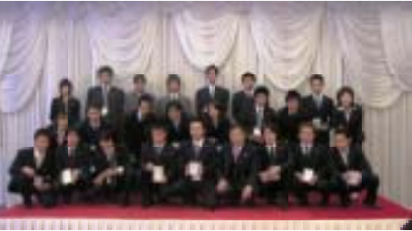
オートベルはがき道 名人のみなさん

意車種表彰の景品が豪華だったので紹介します。まずは得意車種について説明します。車の事なら何でも聞いてくれる得意な車を作ると言う事です。全社員から得意車種を提出してもらった結果、得点が高い人が今回の受賞者でした。一位の豪華景品は、なんと定価で五十万円もする超最高級ハガリ産羽毛布団です。これを見事受賞したのは浜